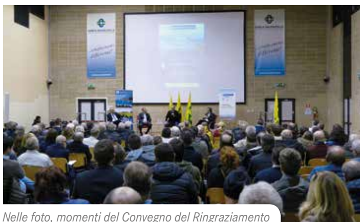
Nelle foto, momenti del Convegno del Ringraziamento

In novembre, infatti, si è tenuto il tradizionale incontro su Vino e Territorio , quest'anno impreziosito dalla presenza dell' Onorevole Paolo De Castro , già Ministro delle politiche agricole alimentari e forestali nel