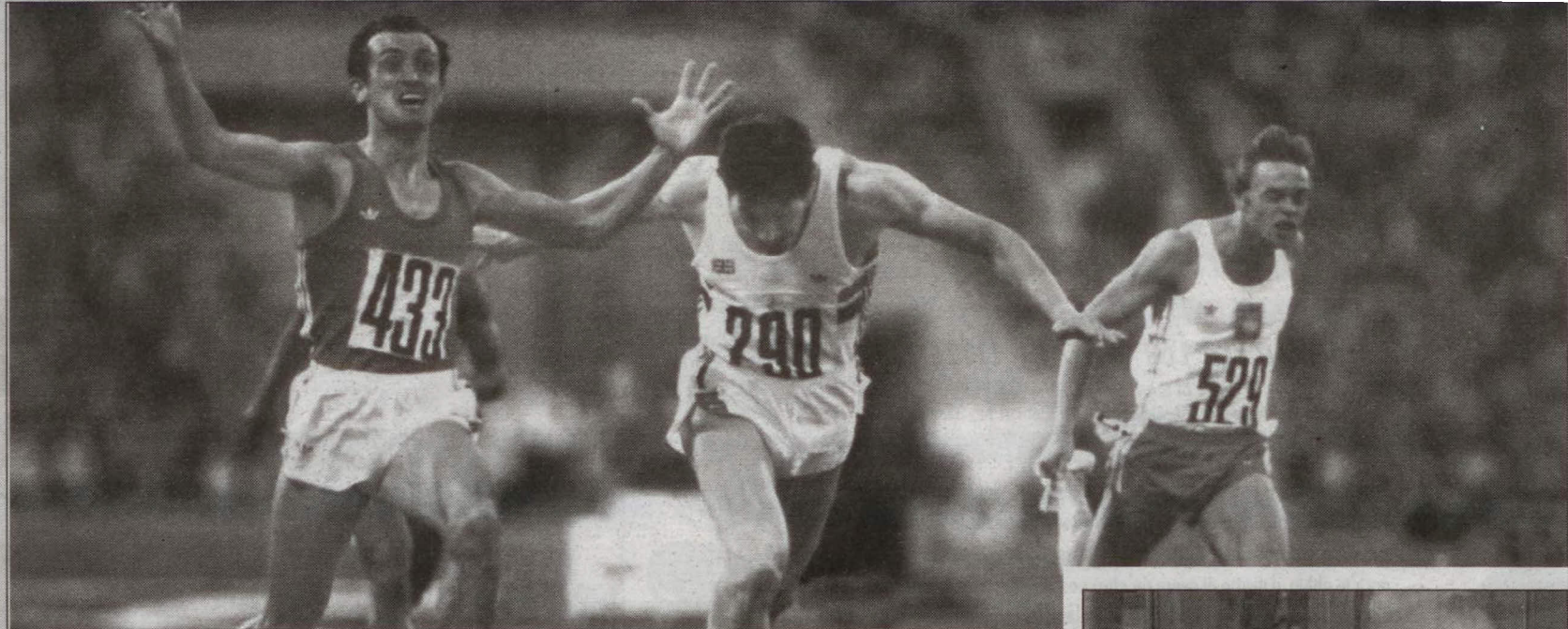
Pietro Mennea ieri e oggi (a destra)