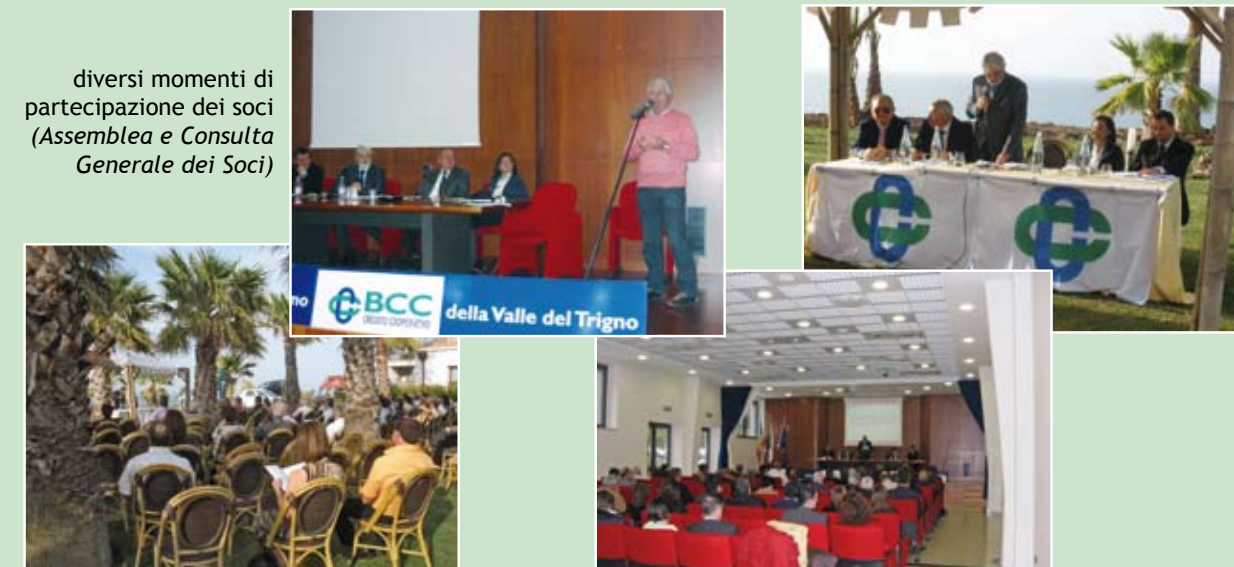
diversi momenti di partecipazione dei soci (Assemblea e Consulta Generale dei Soci)

Nel 2010 è partito "il progetto permanente dai soci per i soci". Un progetto teso a garantire la partecipazione dei soci alla vita della cooperativa, a rendere effettivo lo scambio mutualistico tra i soci e ad essere maggiormente presenti sul territorio favorendo la coesione sociale e la sua crescita responsabile e sostenibile, promuovendo lo sviluppo della cooperazione e, quindi, ampliando la compagine sociale nell'area di competenza con evidenti ritorni patrimoniali, oltre che operativi. Nel mese di dicembre 2009 vengono riunite le prime assemblee territoriali, e a gennaio 2010 sono stati istituiti i 4 comitati locali dei soci della BCC DELLA VALLE DEL TRIGNO e la CONSULTA GENERALE DEI SOCI.