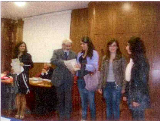
La premiazione dello scorso anno

VASTO – Per il secondo anno consecutivo la BCC della Valle del Trigno premia i due studenti soci o figli di soci più meritevoli.