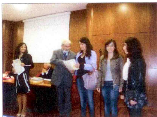
Un momento della premiazione alla Bcc