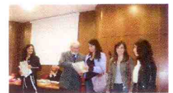
La Bcc d Trigno ha studenti Termoli c 2012