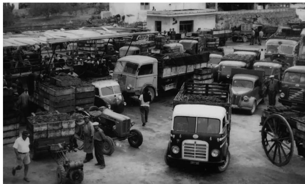
Immagine di copertina Cantina Sociale di Ostuni