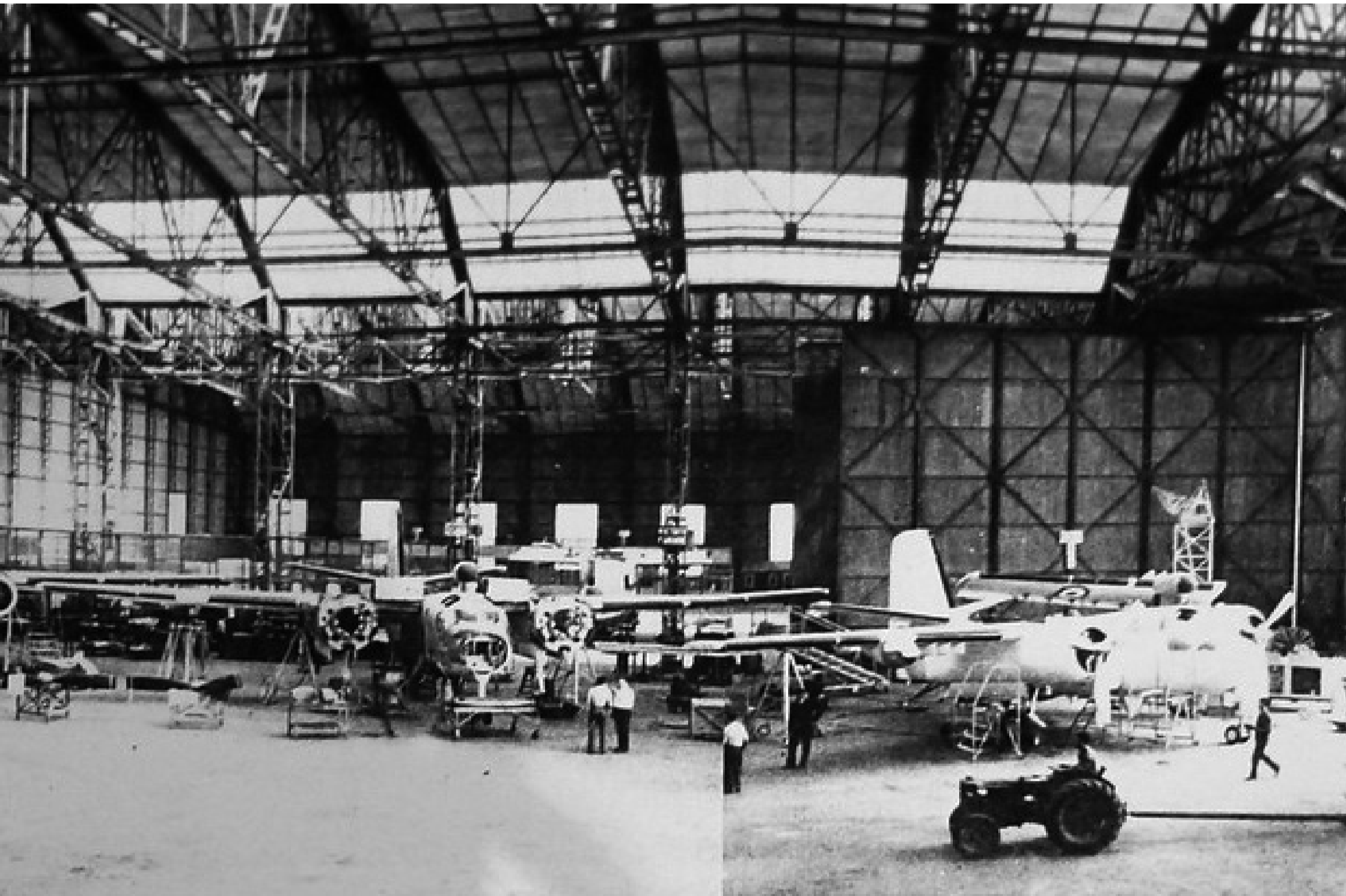
Saca - Brindisi

L a SACA (Società Cantieri di Aeroporto) fu costituita nel maggio del 1934 e dopo pochi anni aveva già costruito grandi capannoni con officine su dodicimila metri quadrati di terreno.