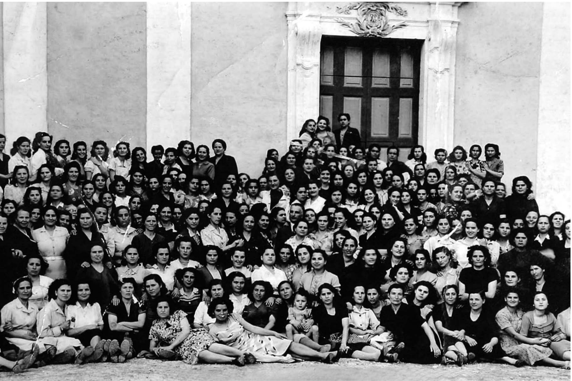
Le lavoratrici della Manifattura dei Tabacchi - Ostuni

La Conceria del Tabacco, una fabbrica costruita negli anni Venti del Novecento, era un edificio di rilevante importanza poiché in esso si lavorava tutto il tabacco necessario alla produzione delle sigarette per la popolazione locale. I vari prodotti, che si ottenevano per essiccazione delle foglie della pianta opportunamente trattate e lavorate, erano il tabacco da fumo, il tabacco da fiuto e il tabacco trinciato, ognuno di differente qualità.