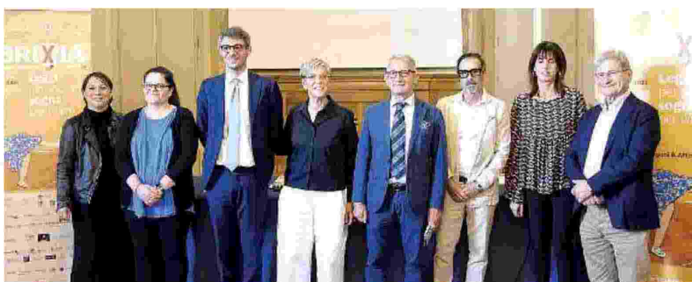
La presentazione. Numerose le collaborazioni di Librixia

Ritaglio stampa ad uso esclusivo del destinatario, non riproducibile.