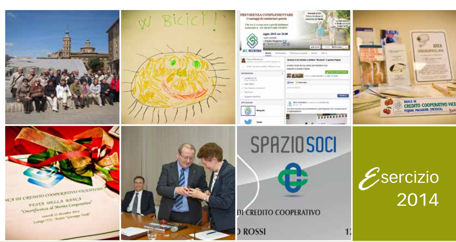
Bcc Vicentino - ed. maggio 2015 a cura MK&C BCC VI - Realizzazione AGM Grafica - 0444 861478

Bilancio Sociale, di Missione e di Coerenza