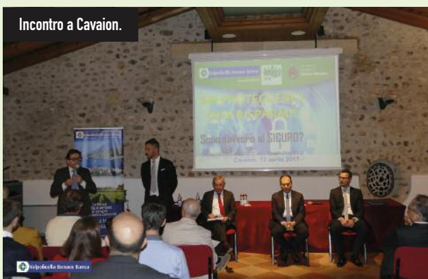
Incontro a Cavaion.