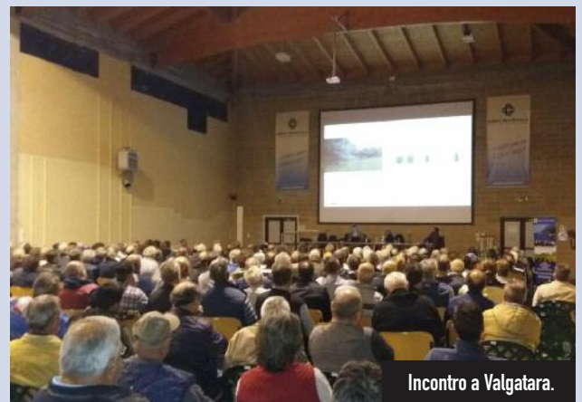
Incontro a Valgatarà.