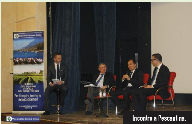
Incontro a Pescantina.